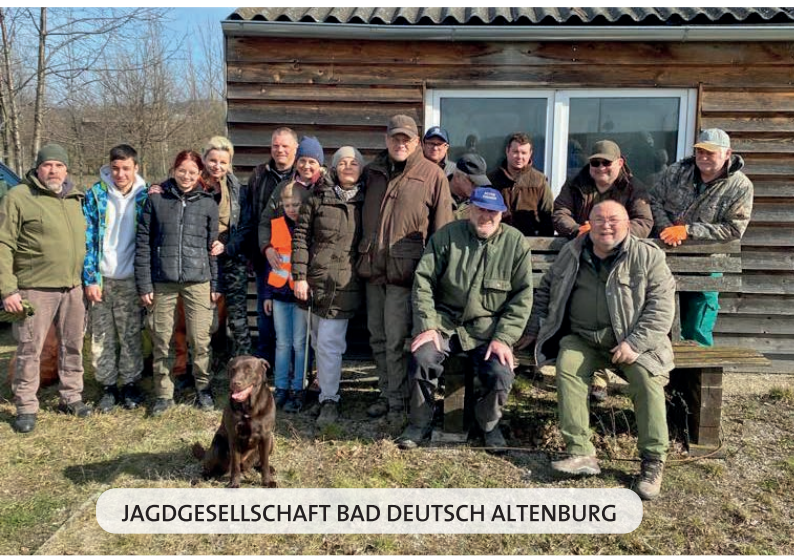
JAGDGESELLSCHAFT BAD DEUTSCH ALTENBURG