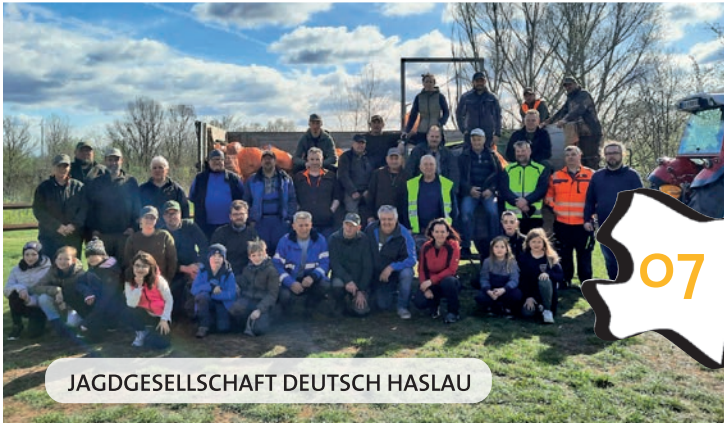
JAGDGESELLSCHAFT DEUTSCH HASLAU