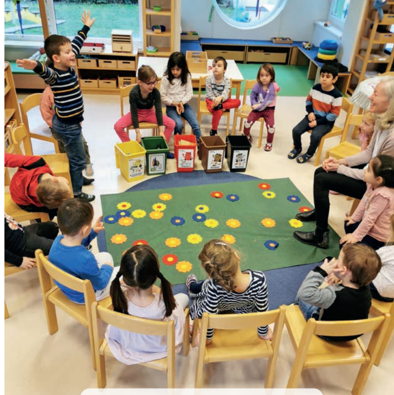
KINDERGARTEN BAD DEUTSCH ALTENBURG