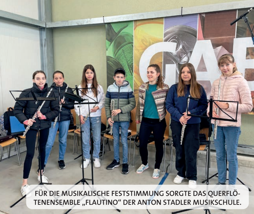
FÜR DIE MUSIKALISCHE FESTSTIMMUNG SORGT DAS QUERFLÖTENENSEMBLE „FLAUTINO“ DER ANTON STADLER MUSIKSCHULE.