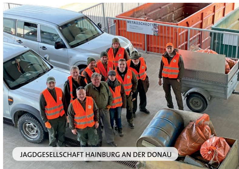
JAGDGESELLSCHAFT HAINBURG AN DER DONAU