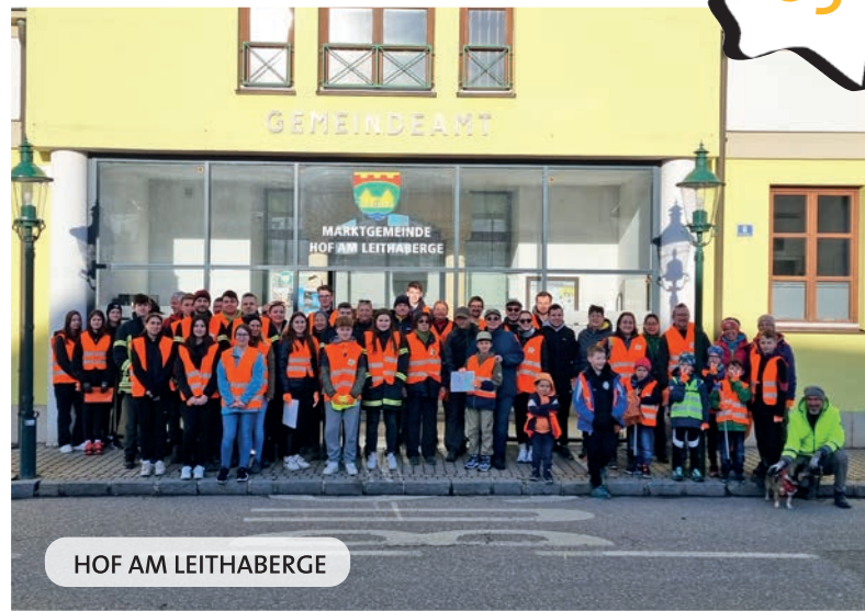
HOF AM LEITHABERGE