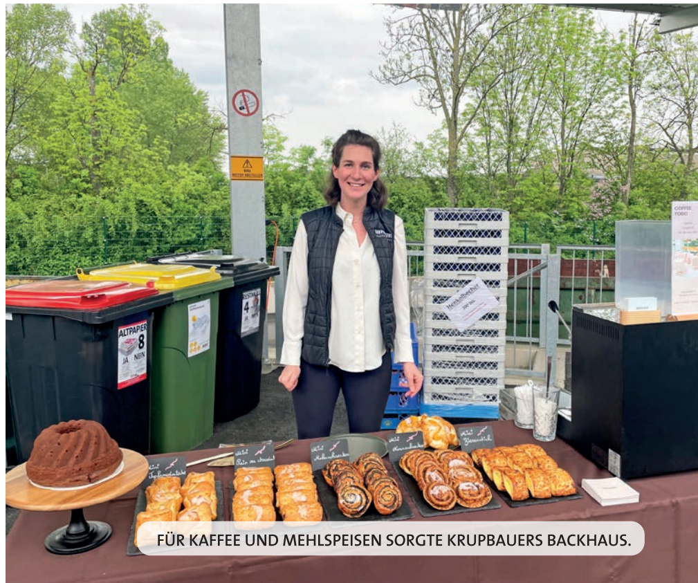
FÜR KAFFEE UND MEHLSPEISEN SORGT KRUPBAUERS BACKHAUS.