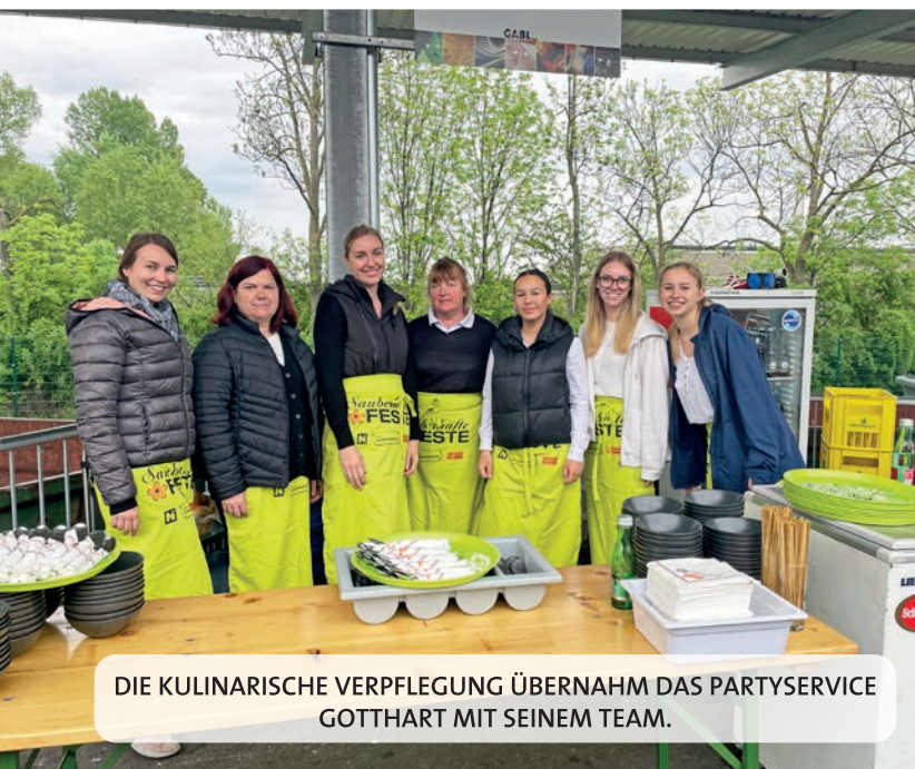
DIE KULINARISCHE VERPFLEGUNG ÜBERNAHM DAS PARTYSERVICE GOTTHART MIT SEINEM TEAM.