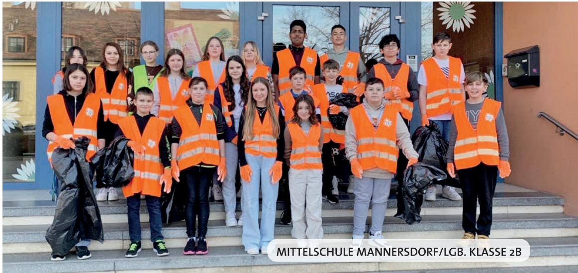
MITTELSCHULE MANNERSDORF/LGB. KLASSE 2B